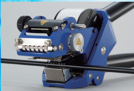
電線／コントロールケーブル