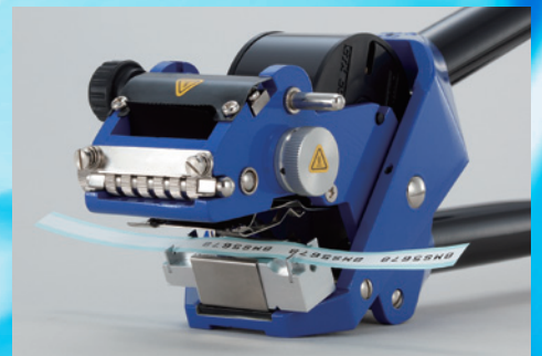
マーカラベル M52-17(オプション治具)